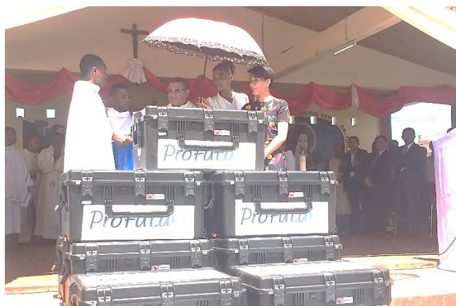
BENEDICTION DES MATERIELS EN PRESENCE

Pape François, doit permettre de développer les compétences numériques des élèves et des enseignants de l'école primaire par l'utilisation de tablettes intégrant des données éducatives. L'objectif est de favoriser l'égalité des chances des enfants de par le monde donc rien avoir avec les tablettes qui ont accès à internet. C'est une « bibliothèque numérique » pour les enfants.