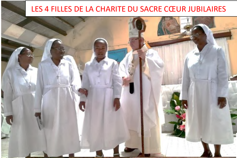
LES 4 FILLES DE LA CHARITE DU SACRE CŒUR JUBILAIRES