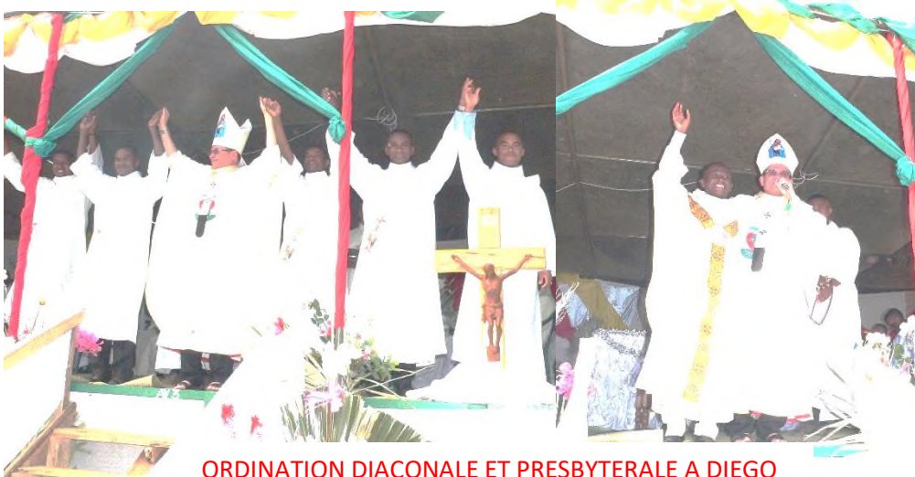
ORDINATION DIACONALE ET PRESBYTERALE A DIEGO

« Voilà l'œuvre du Seigneur, la merveille devant nos yeux »