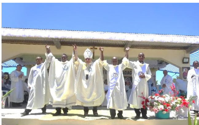
ORDINATION DIACONALE ET PRESBYTERALE A VOHEMAR

faire revivre ces grands moments inoubliables !