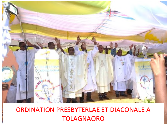
ORDINATION PRESBYTERALE ET DIACONALE A TOLAGNAORO

l'œuvre du Seigneur la merveille devant nos yeux » ! Il y a beaucoup de leçons à tirer à partir de ces célébrations, toutes merveilleusement préparées par leurs responsables que j'en profite pour féliciter ici. Je laisse d'ailleurs les photos et les commentaires ci-dessous vous