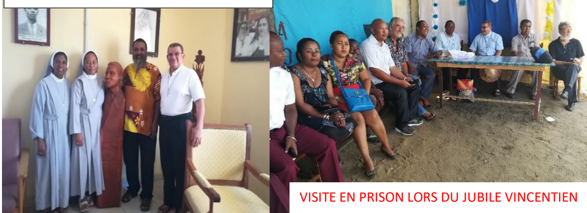
VISITE EN PRISON LORS DU JUBILE VINCENTIEN