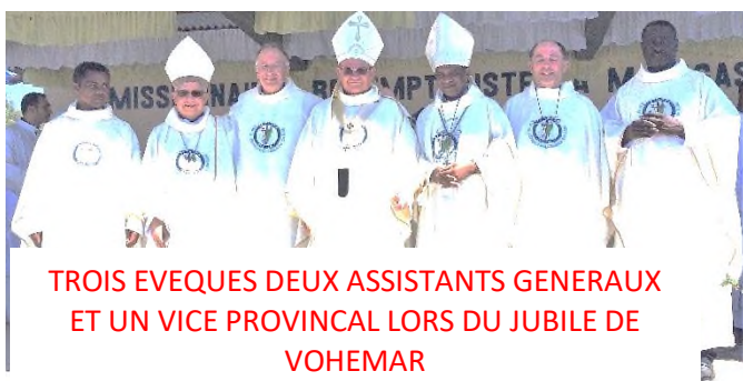
TROIS EVEQUES DEUX ASSISTANTS GENERAUX ET UN VICE PROVINCIAL LORS DU JUBILE DE VOHEMAR

Le samedi matin, tous participent à une grande marche évangélique dans la ville de Vohemar. Le cortège débute sa marche au tapis vert, à quelques kilomètres sur la route de Sambava. Il fait plusieurs centaines de mètres ! Les écoles vertes du projet de réconciliation des jeunes avec l'environnement, financé par l'ONG Manos Unidas, marchent en tête. Ce projet vise à développer la conscience écologique dans les écoles par des formations et des actions concrètes telles que la gestion des déchets ou le reboisement. Équipés de pelles, brouettes et bêches, et vêtus de vert, ils poussent un chariot couvert de plantes.