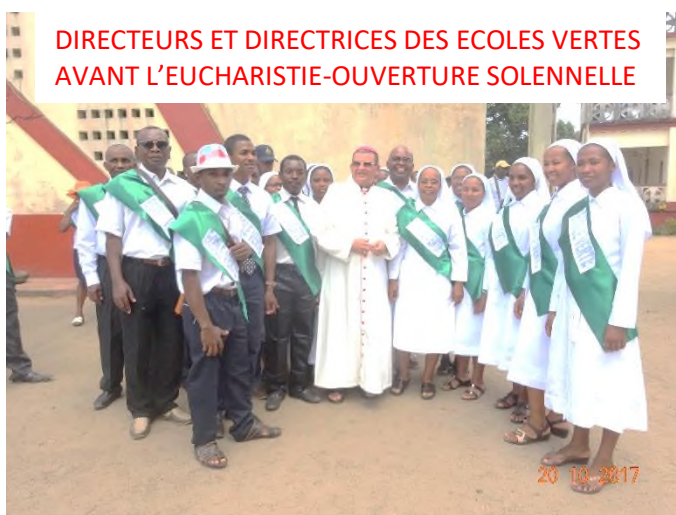
DIRECTEURS ET DIRECTRICES DES ECOLES VERTES AVANT L'EUCARISTIE-OUVERTURE SOLENNELLE

Justement pour marquer cette réelle volonté il a fait un don à la Didec fut la bénédiction des matériels scolaires Profuturo en présence de la Dame. Après la foule reçu la bénédiction l'année scolaire. La messe l'honneur du Couple sont projetés des vidéos projets du diocèse dans le domaine de l'éducation la priorité de diocèse. Merci accompagnent pour que ce reconnaissent tous à travers cet article. Que Dieu vous bénisse et nous comptons beaucoup sur vous.