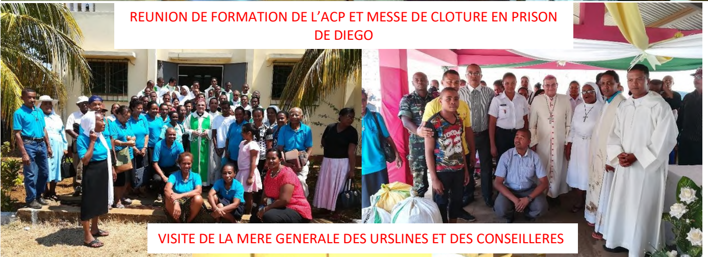
VISITE DE LA MERE GENERALE DES URSLINES ET DES CONSEILLERES