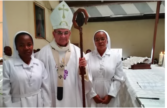
LA SŒUR FILLE DE LA CHARITE DU SACRE CŒUR QUI PROFESSE LES VOEUX PERPETUELS