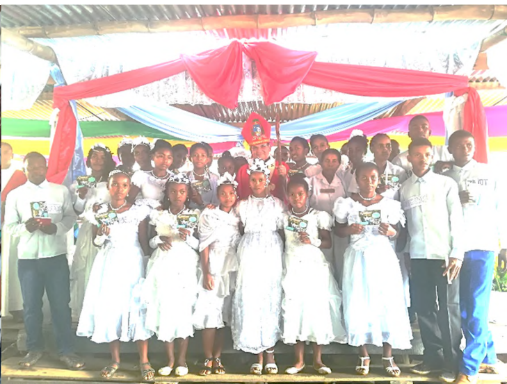
MOUVEMENT D'ENSEMBLE DES ELEVES DE STE THERESE SAMBA