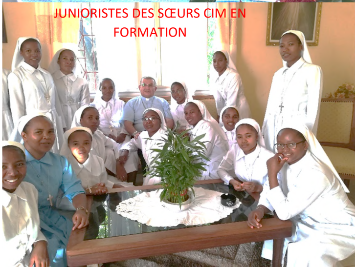
JUNIORISTES DES SCEURS CIM EN FORMATION