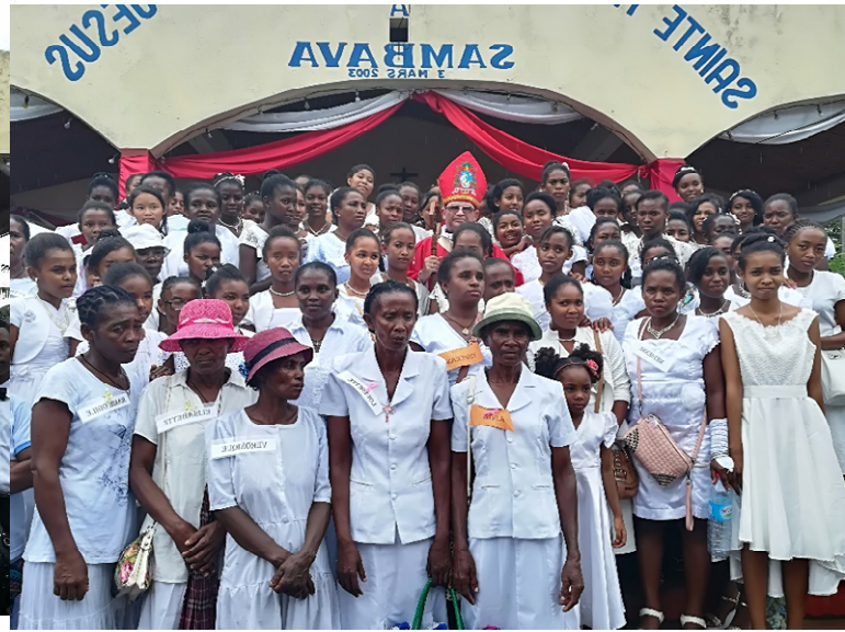
NOUVELLE EGLISE ST MARC D'AMPANAMENA