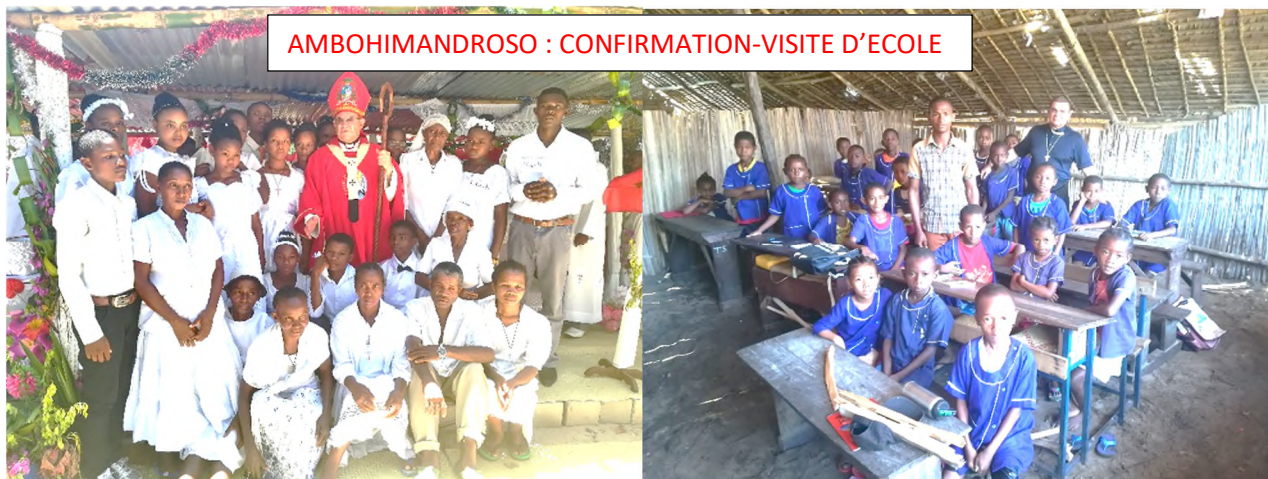
AMBOHIMANDROSO : CONFIRMATION-VISITE D'ECOLE

« Si nous avons reçu des qualités du Père céleste, a-t-il poursuivi, nous devons les mettre au service des frères, et non pas en tirer profit pour notre satisfaction et notre intérêt personnel. Nous ne devons pas nous considérer supérieurs aux autres ; la modestie est essentielle pour une existence qui veut être conforme à l'enseignement de Jésus, qui est doux et humble de coeur et qui est venu non pour être servi, mais pour servir.